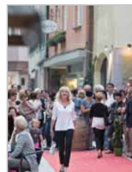
Mühlgässler Modifest am 9. September