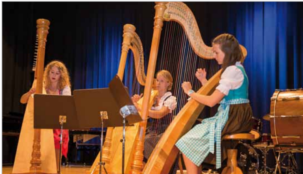
Drei Harfenistinnen beim Schlusskonzert.

Die neuen Termine werden im Herbst veröffentlicht werden. Informationen unter www.bludenz.at/musikschule oder musikschule@bludenz.at Tel. 63621-426