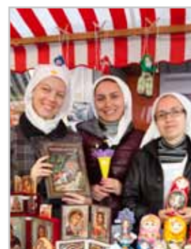
21. Bludener Klostermarkt am 2. und 3. September

17. September 2016 Bludener Erntedankmarkt