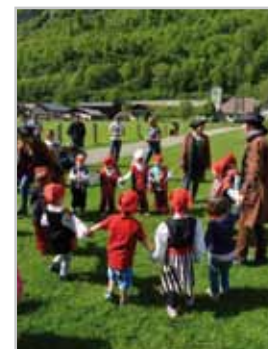
Tolles Piratenfest in der Kleinkindbetreuung „Bingser Zwergle“