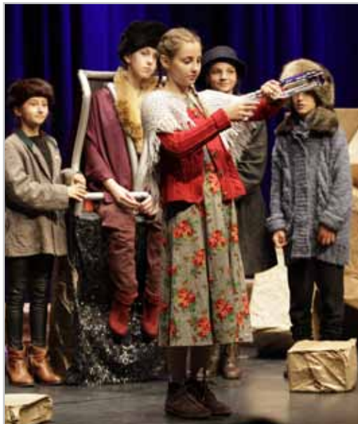
Theateraufführung bei der Kulturnacht: Herzog Friedrich.

Präsentation Zwischenbericht Infrastruktur - neues Gebührenmodell