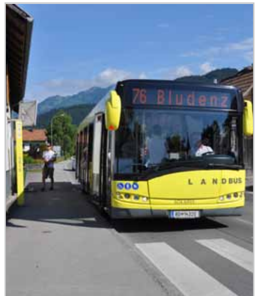
Die Meinung der LandbusnutzerInnen ist gefragt.

Die Befragungen werden zum einen in den Linienbussen von den VVV-Mobilbegleitern durchgeführt, zum anderen kann der kurze Fragebogen auch im Rathaus oder elektronisch auf der Homepage ausgefüllt werden.