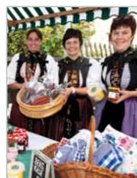
Bludener Erntedankmarkt am 17. September