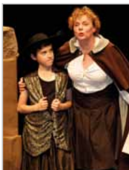
Schlusszene aus „Herzog Friedrich“

Im gerade zu Ende gegangenen Schuljahr 2015/16 kann die Musikschule wieder auf eine Fülle an gelungenen und gut besuchten Veranstaltungen zurückblicken. Damit ist sie ein wichtiger Kulturträger in Bludenz und der Region.