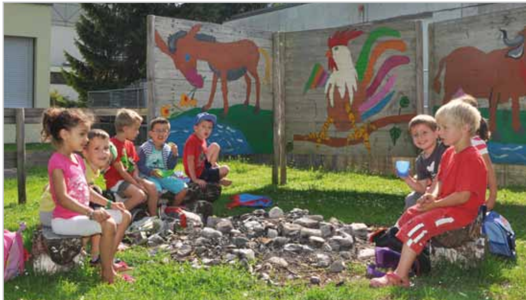
Spiel, Spaß, Aktivitäten und Ferienstimmung stehen im Sommerkindergarten an erster Stelle.