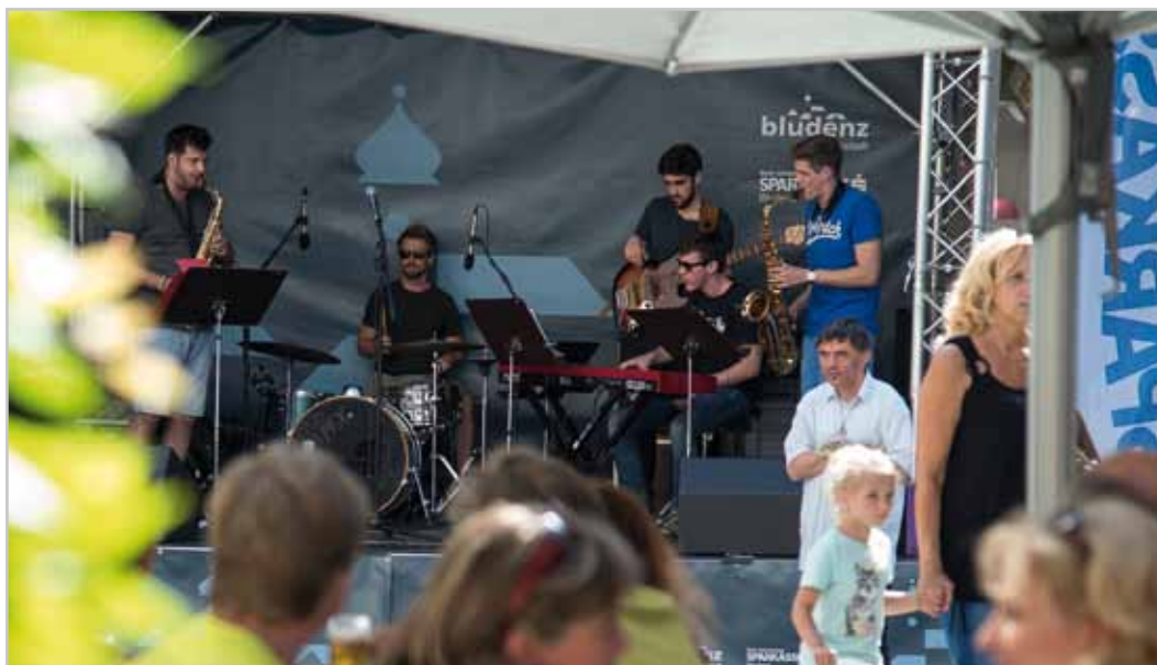
Die Heavytones sind das Highlight des dreitägigen Jazzfestivals „Jazz & Groove“.

Weitere Informationen Bludenz Stadtmarketing GmbH Tel. 05552 63621-258, stadtmarketing@bludenz.at www.bludenz.at , www.bludenz.travel