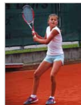
Ein Top-Tennisevent: 2. European Junior Open 2016