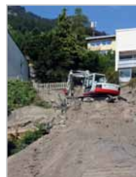
Totalsperren tagsüber sind unvermeidbar, Ersatzwege werden eingerichtet.

Kontakt: a.tagwerker@a1.net Tel.0676-7799833