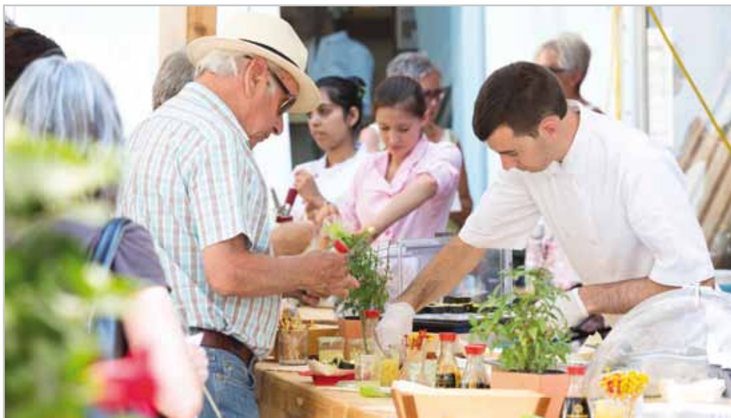
Alpen Culinary - Street Food Festival am Donnerstag, 11. August, in Bludenz.

Am Donnerstag, 11. August 2016, geht das Alpen Culinary Street Food Festival in die zweite Runde: In der Bludener Altstadt werden kulinarische Highlights und kreative Spezialitäten regionaler Gastronomiebetriebe geboten.