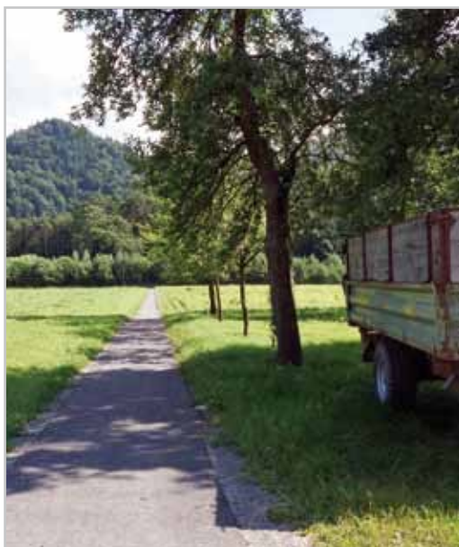
Ein sicherer Verbindungsweg zur Schule.

Verbindung zwischen Bings und Unterbings