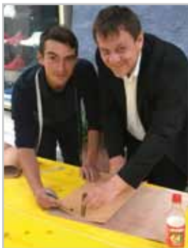
Handwerk und Kreativität bei der Kulturnacht

Kunst und Kultur bieten den Menschen Freiräume zur Entfaltung, das müssen wir uns immer wieder vor Augen haben. Wir müssen gemeinsame Wege der Kommunikation definieren und uns immer wieder darauf besinnen, dass wir in einer der lebenswertesten Regionen der Welt leben.