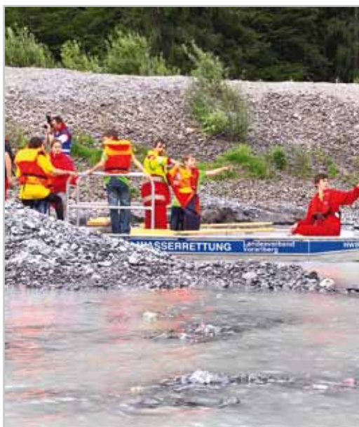
Rettungsaktion im Wasser.

Übung der Jugendblaulichtorganisationen im Raum Bludenz