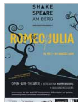
Shakespeare am Berg