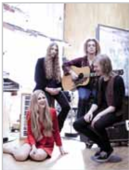
Blues Pills - einer der Hauptacts beim Woodrock-Festival.

Am Wochenende vom 14. bis 16. Juli wird es in Hinterplärsch wieder laut. Bereits zum 22. Mal ist das Woodrock-Festival angesagt und bereichert die oberländer Musik- und Kulturszene.