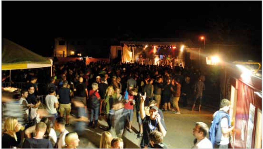
In Hinterplärsch wird beim 22. Woodrock-Festival ordentlich gerockt.

Offene Jugendarbeit Bludenz, Villa K Jellerstraße 16 6700 Bludenz Tel. 05552 33023 office@villak.at www.villak.at