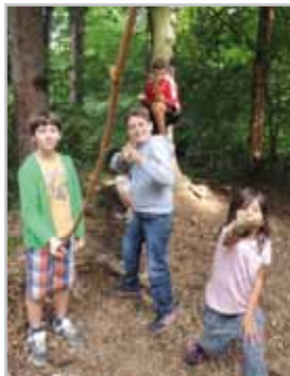
Abenteuer pur gibt es in den „Inselwochen“

Sommerkindergarten, Waldwoche, d'Insel und Schülerbetreuung