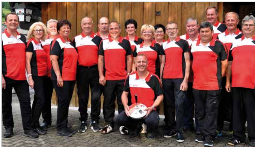
Die erfolgreichen Eisstockschützen im neuen Vereinsdress.