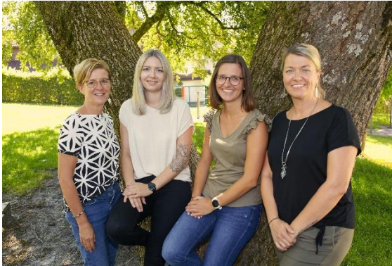
Gruppe 1 – „Häsle-Gruppen“