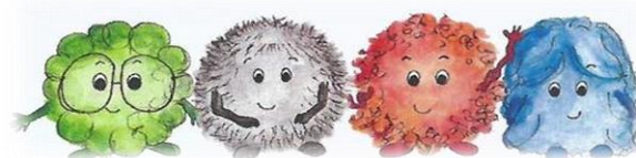
Grieni, Antra, Rienchen & Blu freuen sich schon!

Zusammen meistern die Wusel Herausforderungen, auf welche sie im Alltag stoßen. Durch ihre verschiedenen Charaktereigenschaften und Sozialisierungen ist dies gar nicht immer so leicht. Um eine Gemeinschaft zu bilden, müssen sie miteinander Kompromisse schließen und gemeinsam Probleme lösen.