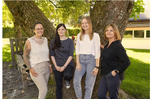
Gruppe 2 – „Füchsle-Gruppen“