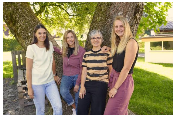
Gruppe 4 – „Fröschle-Gruppen“