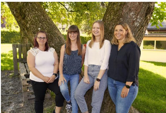
Gruppe 3 – „Bärle-Gruppen“